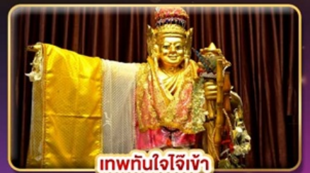
เทพทันใจไว้เจ้า