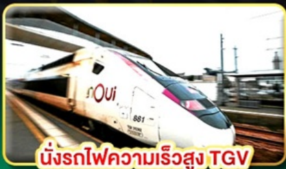
นั่งรถไฟความเร็วสูง TGV