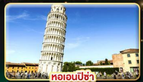
หออนปีซ่า