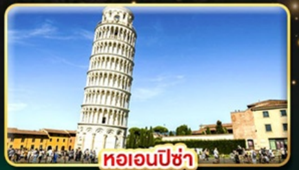
หออนพีซ่า