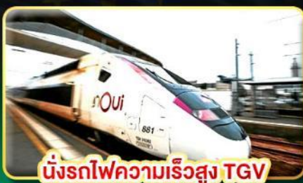
นั่งรถไฟความเร็วสูง TGV