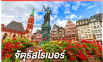
จัตุรัสโรเมอร์