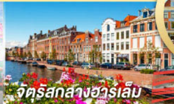
จัตุรัสกลางฮาร์เล็ม