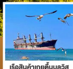
เรือสินค้าเกย์ตันบลูวีส