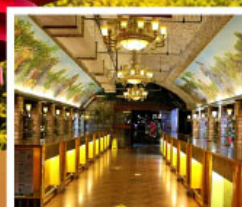
พิพอร์กัทไวน์ชิงเต่า