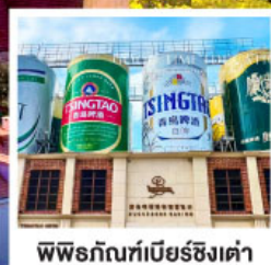
พิพอร์กัทเบียร์ชิงเต่า