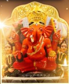
องค์สิทธินายัก