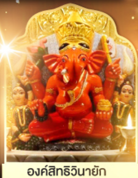
องค์สิทธินายก