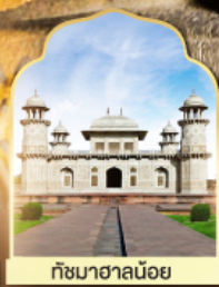
ทัชมาฮาลน้อย