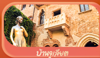
บ้านจูเลียต

เวนิส มิลาน เวโรนา ซูริก ลูเซิร์น โลซาน เซอร์แมท