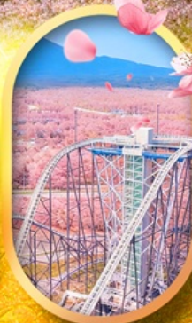
ฟูจิยาม่า ทาวเวอร์