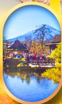
หมู่บ้านน้ำใส