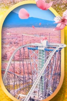
ฟูจิยาม่า ทาวเวอร์