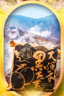
หุบเขาโอวาคุดานิ