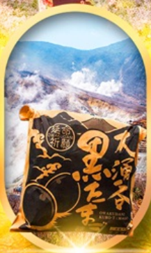
หุบเขาโอวาคุดานิ