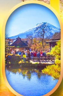
หมู่บ้านน้ำใส