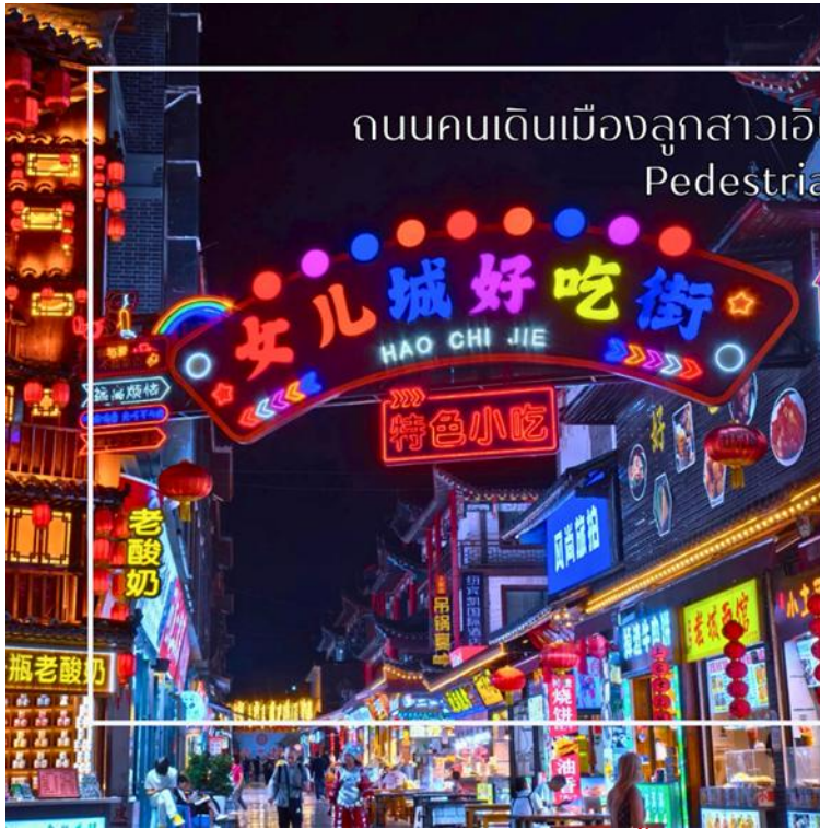
ถนนคนเดินเมืองลูกสาวเินซือ (Enshi Daughter City Pedestrian Street)