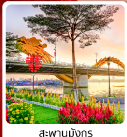
สะพานมิงกง