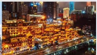
หงหยาดัง(ตอนกลางคืน)

*ทางบริษัทฯ ขอสงวนสิทธิ์ในการสลับโปรแกรมทัวร์ตามความเหมาะสมขึ้นอยู่กับสถานการณ์หน้างาน โดยคำนึงถึงผลประโยชน์ของลูกค้าเป็นสำคัญ