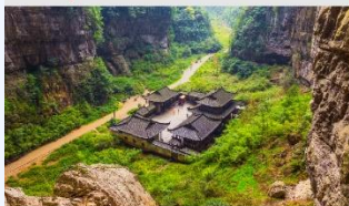
อุทยานหลุมฟ้าสะพานสวรรค์