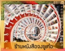
ร้านหนังสือจตุเก๋