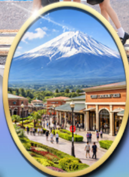
Gotemba Premium Outlets

รหัสทัวร์ RJ-XJ133 เดินทาง 5D 3N กันยายน 2569