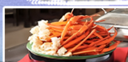
บุฟเฟ่ต์อาหารเย็น + ชาปู 1 มื้อ

พิเศษ! นั่งรถไฟสาย Enoden Line โฮเทล พิเศษ! อิสระท่องเที่ยว 1 วันเต็ม