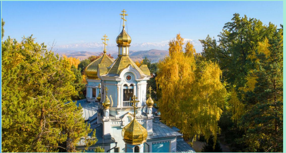
KAZAN ICON OF THE MOTHER OF GOD CATHEDRAL