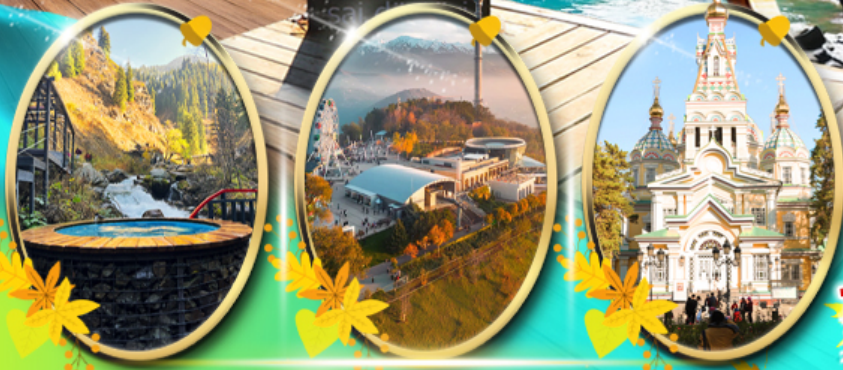
Alma Arasan Gorge Kok Tobe Zenkov Cathedral