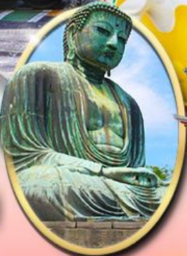
พระใหญ่คามาคูระ