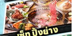
เซ็ท บิงย่าง