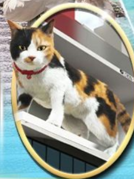
ซอยบิง ชินจูกุ