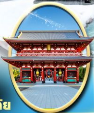
วัด เซ็นโซจิ