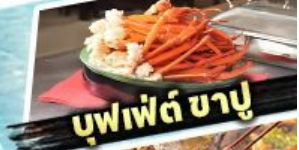
บุฟเฟต์ ซาปู