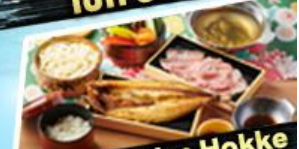
เซ็ทซาปู + ปาฮา Hokke

36,919 ราคา เริ่มต้น บาท รวมภาษีมูลค่าเพิ่ม 7%