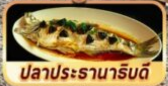
ปลาประธารานริบต์