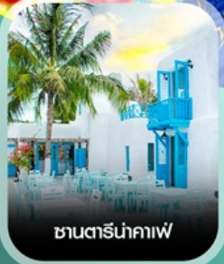
ซานตริ่นคาเฟ