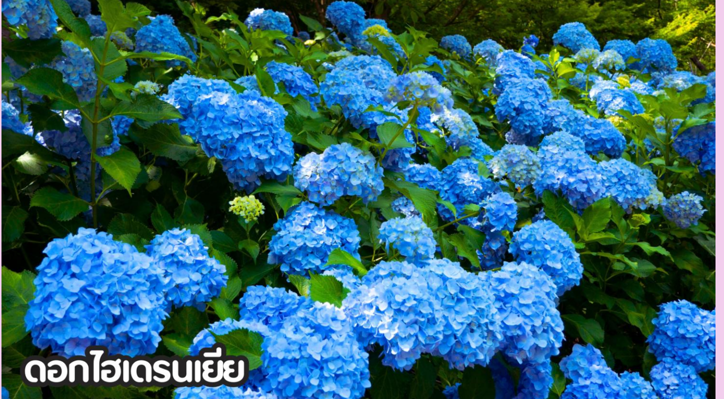
ดอกไฮเดรนเยีย

**หมายเหตุ: โปรแกรมชมดอกไม้ช่วงเดือน พ.ค. - ต.ค.2569 ในช่วง ณ วันเดินทางดังกล่าว หากดอกไม้ยังไม่บานหรืออาจจะร่วงหล่น..ทั้งนี้ขึ้นอยู่กับสภาพอากาศของแต่ละปี ทางบริษัทไม่การันตี และไม่สามารถกำหนดการบานของดอกไม้ได้ ทางบริษัทฯ ขอสงวนสิทธิ์ปรับเปลี่ยนรายการท่องเที่ยวอื่นทดแทนนะคะ รบกวนท่านโปรดทราบและทำความเข้าใจค่ะ**