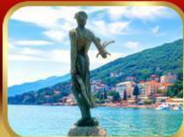
ราชินีแห่งอาเดรียติก โฟพาทิช