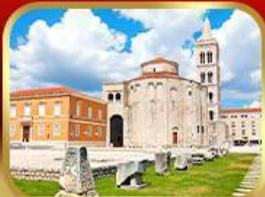
โบสถ์เซ็นต์โทมัส ซาเกร์