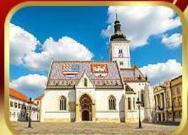
โบสถ์เซ็นต์มาร์ก ซาเกรบ