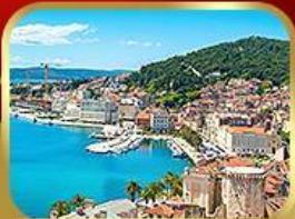
ชมย่านเมืองเก่าสปลิท

14-21 พ.ค. ปรับลดจาก 75,555 18 ที่สุดท้าย 73,333.-