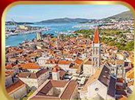
มหาวิทยาลัยเซ็นต์โลว์เรนซ์