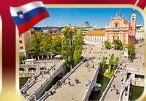
สะพานทริเปิล ลูบลยานิกา