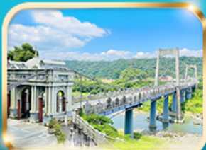
สะพานต้าซี เกาะหยวน