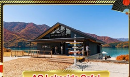
AO Lakeside Cafe'