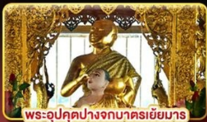
พระอุปคุตปางจกบาตรเยี่ยมาร