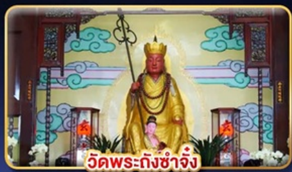
วัดพระถังซำจั๋ง