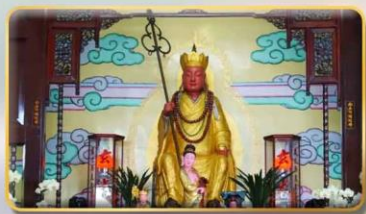
วัดพระถังซำจั๋ง