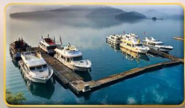
ล่องเรือชมทะเลสาบสุริยันจันทรา