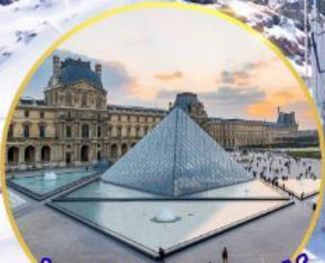
ถ่ายรูปคู่พีพีรภัทท์ที่ลูฟท์