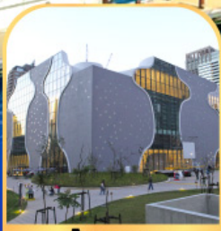
โรงละคร แห่งชาติไถจง