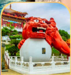
วัดเหวินหลู่