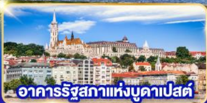
อาคารรัฐสภาแห่งบูดาเปสต์