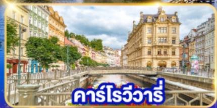
คาร์โรวัวร์