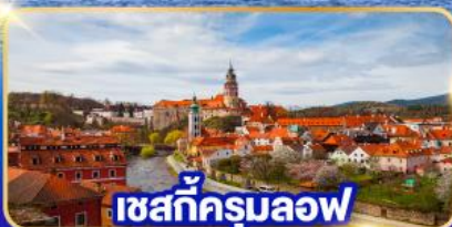
เซสกีครุมลอฟ