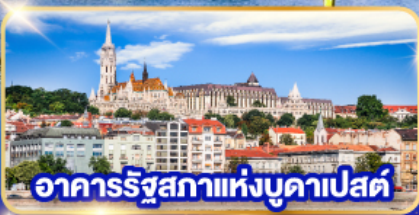
อาคารรัฐสภาแห่งบูดาเปสต์