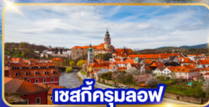
เซสท์ครุมลอฟ