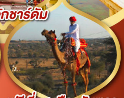
ฟรี ทัชฮอลล์ เมืองมันทาวา ราคาเริ่มต้น