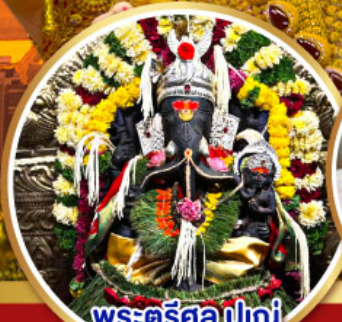
พระตรีศูล ปูเน่ (Trishul Pune)