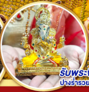
รับพระพิฆเนศวร ปางรำรอย ท่านละ 1 องค์