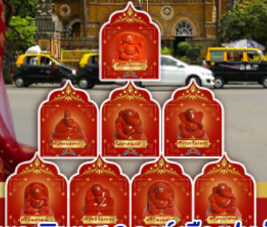
พระพิฆเนศ 8 องค์ เมืองปูเน่