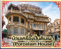
บ้านเครื่องปั้นดินเผา (Porcelain House)

มือพิเศษ.. เปิดปักกิ่ง, ปังย่างเกาหลี, สุกี้ Haidilao