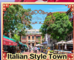
Italian Style Town