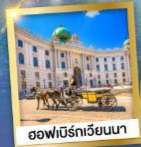
ฮอฟบวร์กเวียนนา