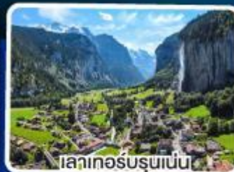
เลาเกอร์บรุนเนน