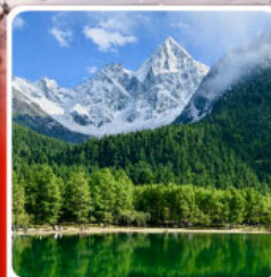
อุทยานบ่ิฝิงโถว