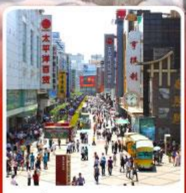
ช้อปปิ้งถนนคนเดินซุนซีลู่