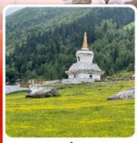
ภูเขาสี่ตรุณี