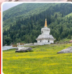
ภูเขาสี่ครุณี