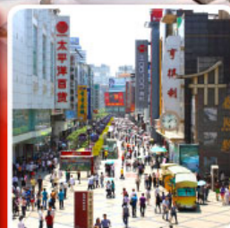
ช้อปปิ้งถนนคนเดินซุนซีอู่