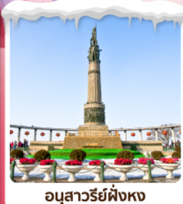
อนุสาวรีย์ฟิ่งหง

• ไอโกล์ ชมความอลังการเทศกาลโคมไฟน้ำแข็ง เที่ยวชมหมู่บ้านหิมะ เช็किनจุด CHINA'S SNOW TOWN ลานสกีฆ่าปูลี่