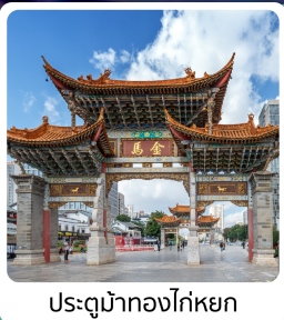
ประตูน้ำทองโก่หยก