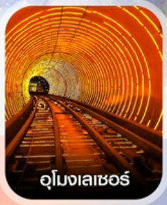
อุโมงเลเซอร์

✈️ คอนเฟิร์มออกเดินทาง ✈️ ทุกพีเรียด 2 ท่านขึ้นไป