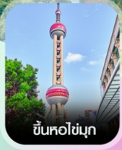
ขึ้นหอไข่มุก