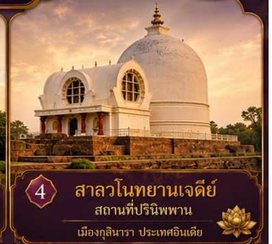
4 ศาลาโนทยานเจดีย์ สถานที่ปรินิพพาน เมืองกุสินารา ประเทศอินเดีย

พร้อมชมสิ่งมหัศจรรย์อินเดียในทริป 9 วัน 7 คืน