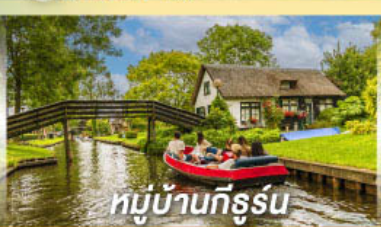
หมู่บ้านทีธูร์น