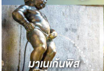
มานเนกันพิส