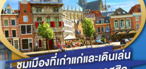
ชมเมืองที่เก่าแก่และเดินเล่น ย่านเมืองเก่าสุดคลาสสิก