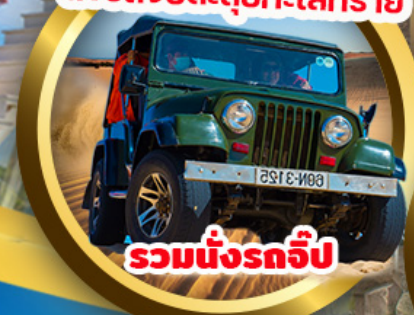
รวมนั่งรถจี๊ป