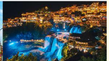
หมู่บ้านโบราณฟูหรงเจิน

*ทางบริษัทฯ ขอสงวนสิทธิ์ในการสลับโปรแกรมทัวร์ตามความเหมาะสมขึ้นอยู่กับสถานการณ์หน้างาน โดยคำนึงถึงผลประโยชน์ของลูกค้าเป็นสำคัญ