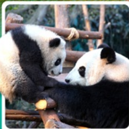
หุบเขาแพนด้าตู่เจียงเอี่ยน