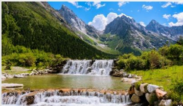
อุทยานแห่งชาติปี้เฟิงโกว