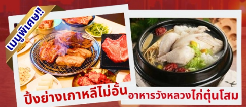
ปิ้งย่างเกาหลีไม่อั้น อาหารวังหลวงไก่ตุ๋นโสม