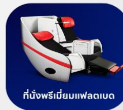
ที่นั่งพรีเมียมฟเลกซ์