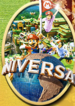
อิสระเลือกซื้อบัตร Universal Studios Japan