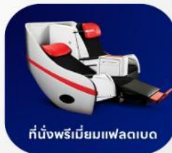
ที่นั่งพรีเมียมแฟลตเบด