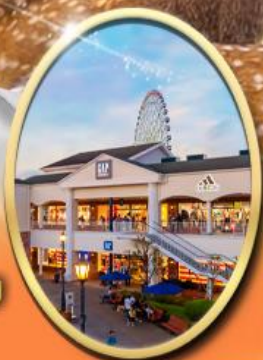
Rinku Premium Outlets