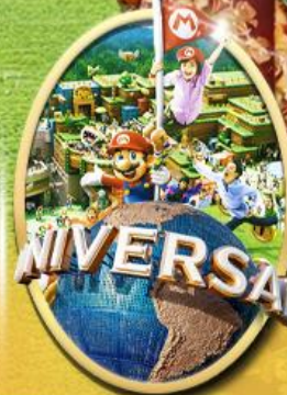
อิสระเลือกซื้อบัตร Universal Studios Japan