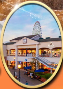
Rinku Premium Outlets