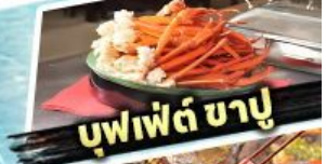
บุฟเฟต์ ชาบู