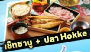
เอ๊กชาบู + ปาจา Hokke

ถนนคาบาสึ ซอยบิง ตลาดอะโอะโอะ ตลาดเช้า มิยาการะ ถนนชินมาจิซูกุ สะพานคาบาสึ