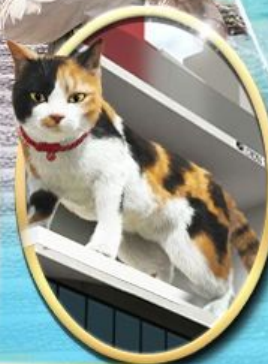
ซอยบิง ชินจูกุ

ราคา 36,919 บาท เริ่มต้น รวมภาษีมูลค่าเพิ่ม 7%