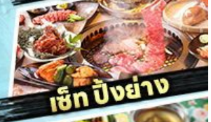
เอ๊ก บิงย่าง