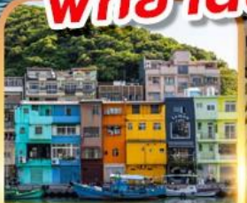
ท่าเรือประมงเจิ้งปิง