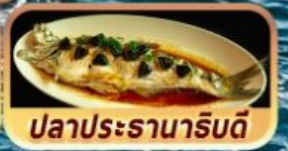
ปลาประจักษ์ริบตี