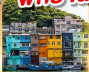
ท่าเรือประมงเจิ้งปิง