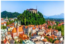
เมืองเก่า