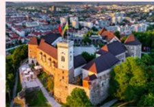
ปราสาทลูบลียานา

** พักที่ Radisson Blu Plaza Hotel 4* หรือเทียบเท่า **