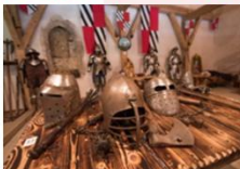
ปราสาทเพรจามา

** พักที่ Radisson Blu Plaza Hotel 4* หรือเทียบเท่า **