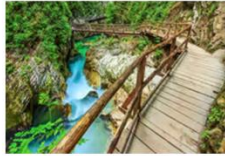
หุบเขาวินท์การ์จอร์จ

** พักที่ Radisson Blu Plaza Hotel 4* หรือเทียบเท่า **