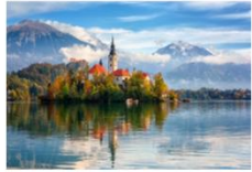
ทะเลสาบเบลด

05.15 น. เดินทางถึงสนามบินอิสตันบูล และเปลี่ยนเครื่อง 07.15 น. ออกเดินทางสู่เมืองลูบลียานา ประเทศสโลวีเนีย เที่ยวบิน TK1061 08.30 น. เดินทางถึงสนามบินลูบลียานา โຈเซ พูซนิค