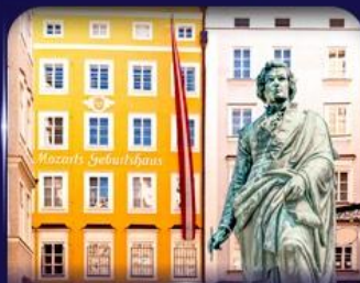
บ้านเกิดโมสาร์ท ซาลซ์บูร์ก