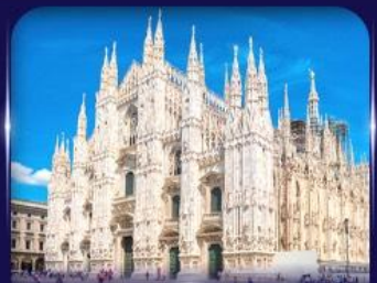
เซ็คอินวิหารดูโอโม มิลาโน