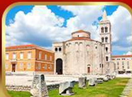
โบสถ์เซ็นต์โทมัส ซาเกรบ