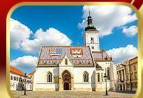
โบสถ์เซ็นต์มาร์ก ซาเกรบ