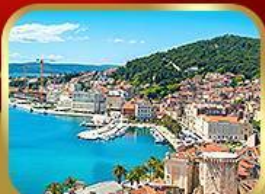
ชมย่านเมืองเก่าสปลิท