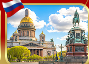
มหาวิหารเซนต์ไอแซค