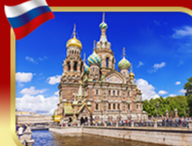
เข็ควอินโบสท์แห่งหยดเลือด