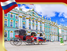
เข้าชมพิพิธภัณฑ์เฮอร์มิเทจ